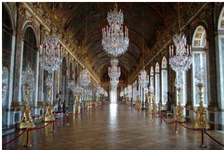
© Galerie des Glaces Château de Versailles - C.Milet

« L'essence de l'arbre » au Musée-Promenade de Marly-le-Roi, le 20 février. En plein hiver, les arbres apparaissent dans toute leur splendeur : écorce, tronc, branches, rameaux son bien visibles. Réalisation d'une série représentant trois arbres avec travail à l'encre et à la plume. Informations et inscriptions : 01 39 69 06 26