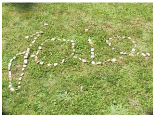
© Ateliers Land Art au Musée de la Ville de Saint-Quentin-en-Yvelines

« Mon archipel en chaussettes » au musée du Jouet de Poissy, le 29 avril. Contes pour les 3-8 ans par Yan Stefan. Informations : 01 39 65 06 06